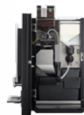
OB 2 (XL) NG