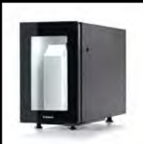
FR - 4l-Milchkühler