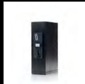
Zahlungssystem - Münzprüfer