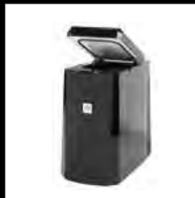
TM - 1 L Milch- Peltierkühler, schwarz