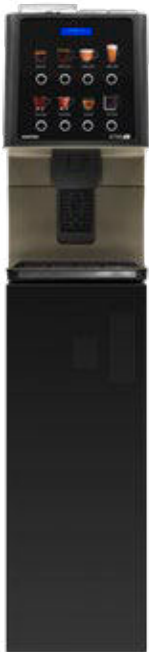
Kit Sockel Vorbereitet für Münzprüfer. (850 mm.)

Auch für den Kaffeeservice in Lebensmittelgeschäften ist sie die perfekte Lösung und für Hotels, in denen das Frühstück gut, aber ebenso schnell sein sollte, bietet die Maschine ein angenehmes Erlebnis, mit einem attraktiven Design, einfach und funktional.