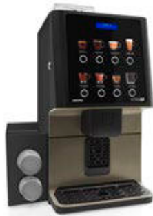
Kit Bechermodule Zum Spenden von Bechern.