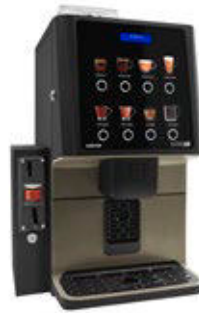
Kit Validierungsmodul Vorbereitet zur Installation eines Münzprüfers.