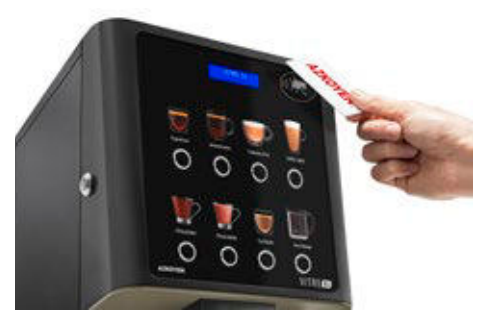
Kit RFID-Lesegerät Für Produktladekarten oder bargeldlose Systeme.